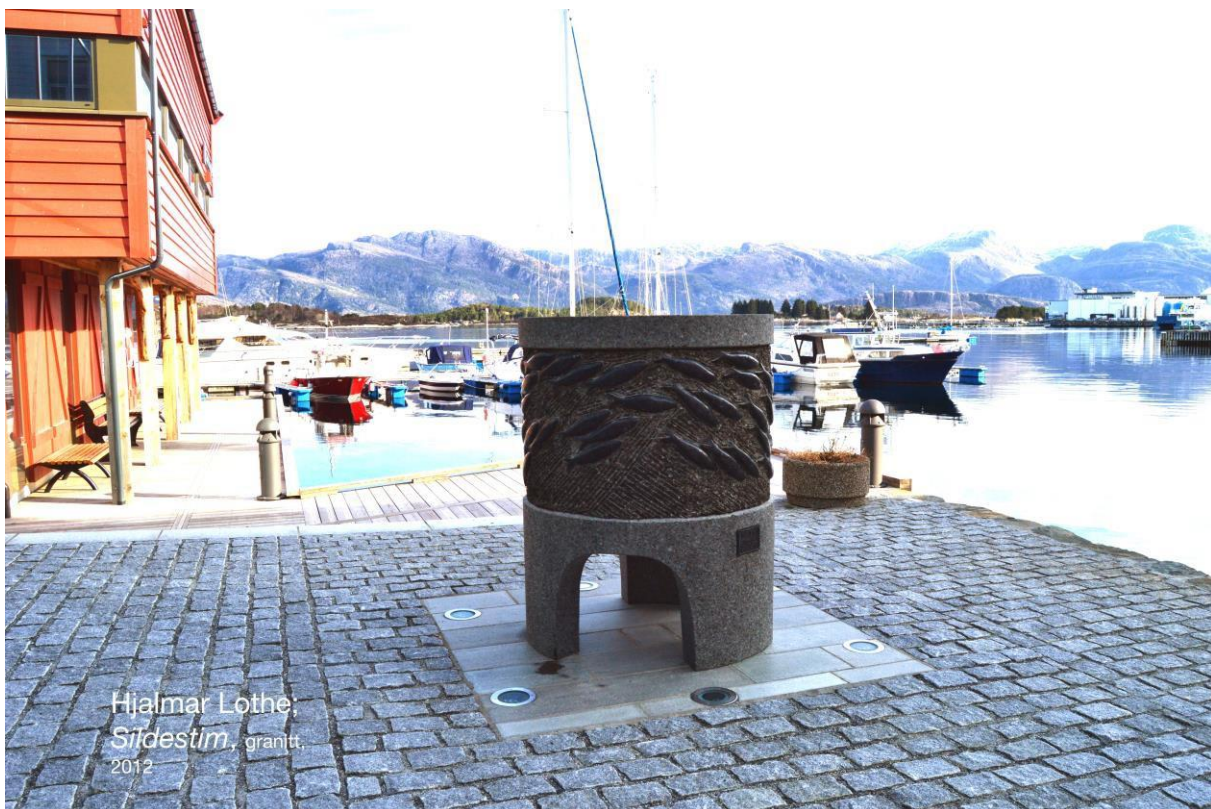
Hjalmar Lothe. 2013. Granitt.