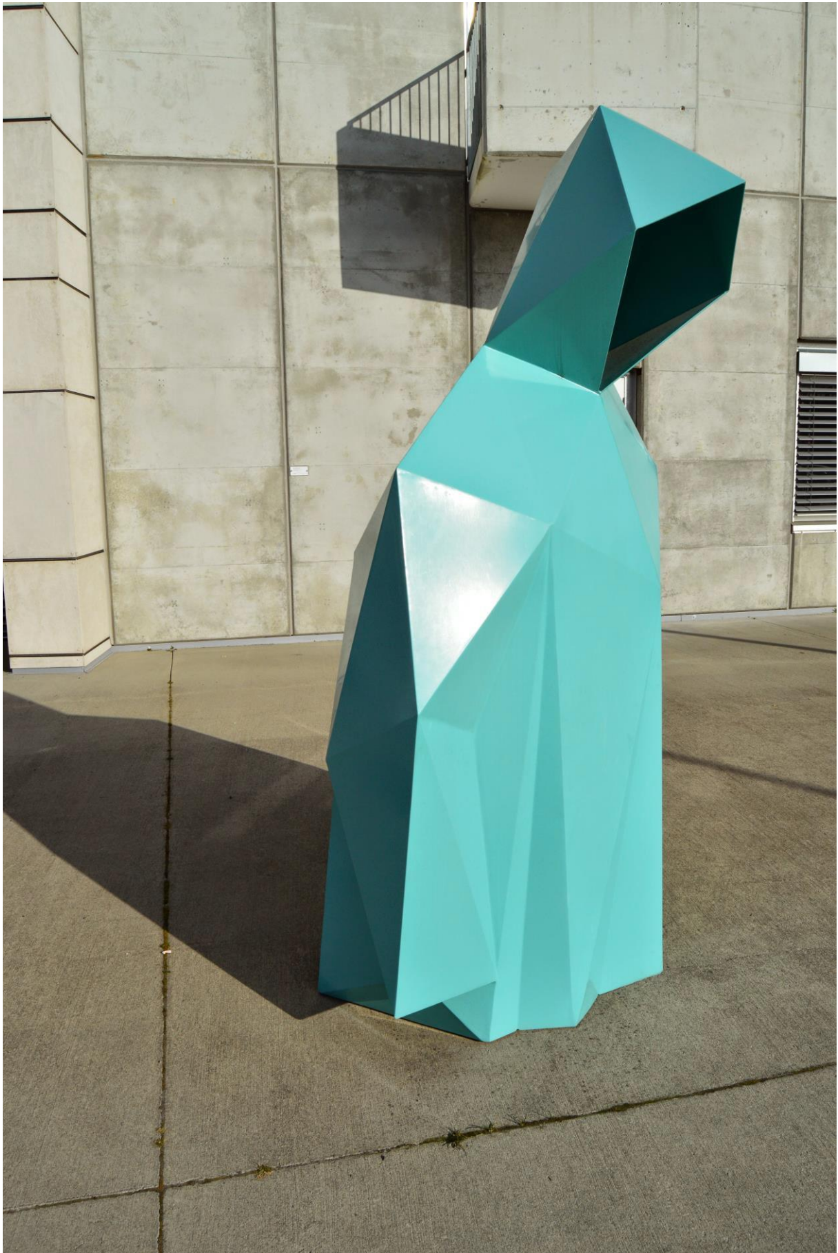
Mikkel Wettré. 2010. Sprøytemalt aluminium.