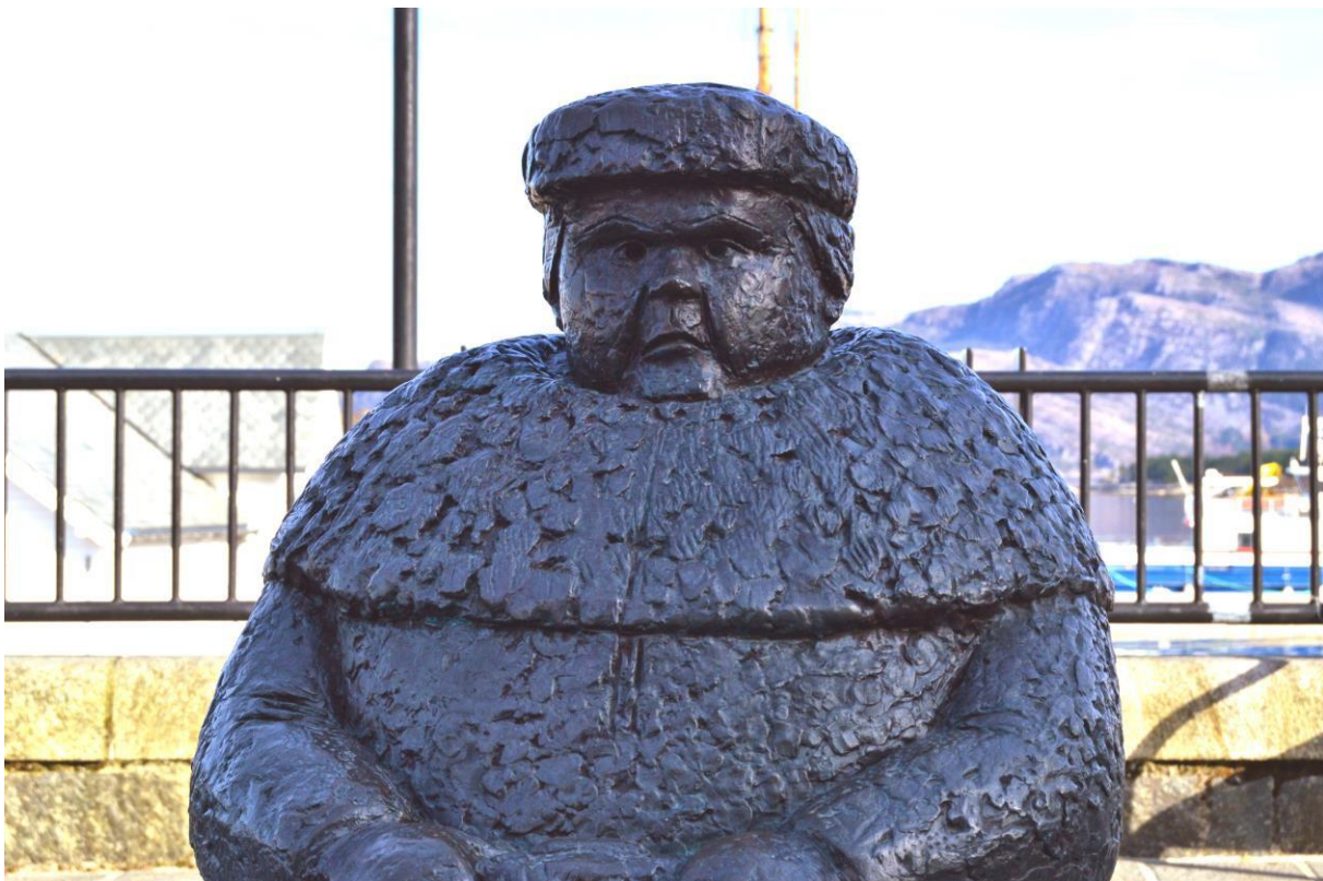
Solveyg Schafferer. 2010. Bronse.