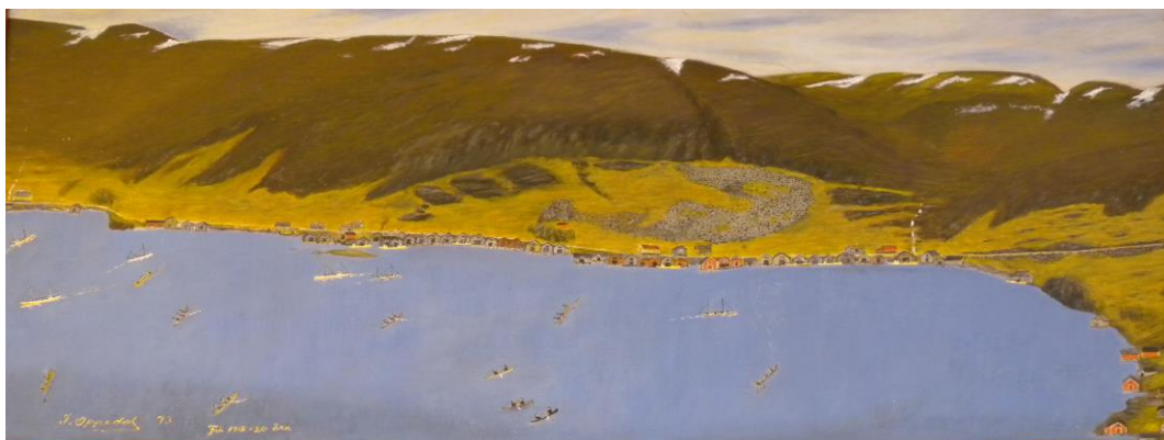
Maleri: Isak Oppedal (1920). Eigar er Gravdal skule.

Bygningstiljøet i Torskangerpollen er godt dokumentert. Eit maleri av Isak Oppedal viser bygningstiljøet rundt 1920, og med namn på alle buer og eigarar. Sommaren 1971 dokumenterte ei gruppe arkitektstudentar frå NTH mange av bygningane gjennom nøyaktige oppmålingar og bilete. Våren 2013 registrerte Fiskerimuseet og Vågsøy Historielag bygningstiljøet i Torskangerpollen ved fotografering og intervju med eigarar og andre. Registreringane er lagde inn på Kulturminnesøk.