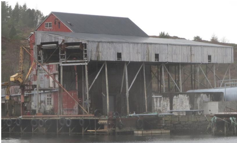
Nothenge i Evja.