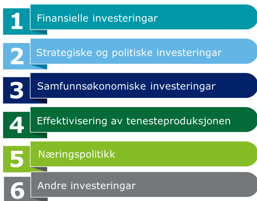
Tabell 1: Oversikt kategoriar

Formålet med å opprette eit selskap eller gå inn i ei etablert selskapsordning skal gå fram av saksframlegget for kommunen sitt vedtak.