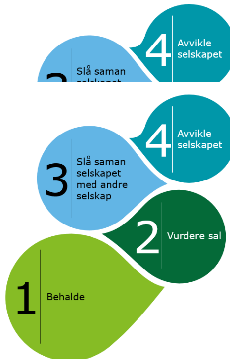
Figur 1: Vurdering av tiltak for eigarskapa

I slike tilfelle kan omorganisering, sal eller avvikling av selskapet vere alternative tiltak, jf. figur 1.