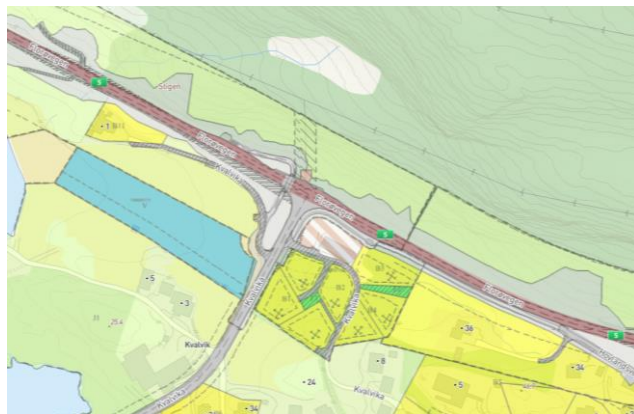
Figur 3 viser gjeldande reguleringsplanar i området

I gjeldande kommunedelplan er store deler av det aktuelle arealet sett av til vegføremål. Tilgrensande areal har føremåla LNFR og bustad. Kommunedelplanen viser faresone for høgspent nord for krysset og heile planområdet ligg innanfor faresone Ras- og skredfare.