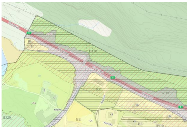
Figur 2 viser gjeldande kommunedelplan