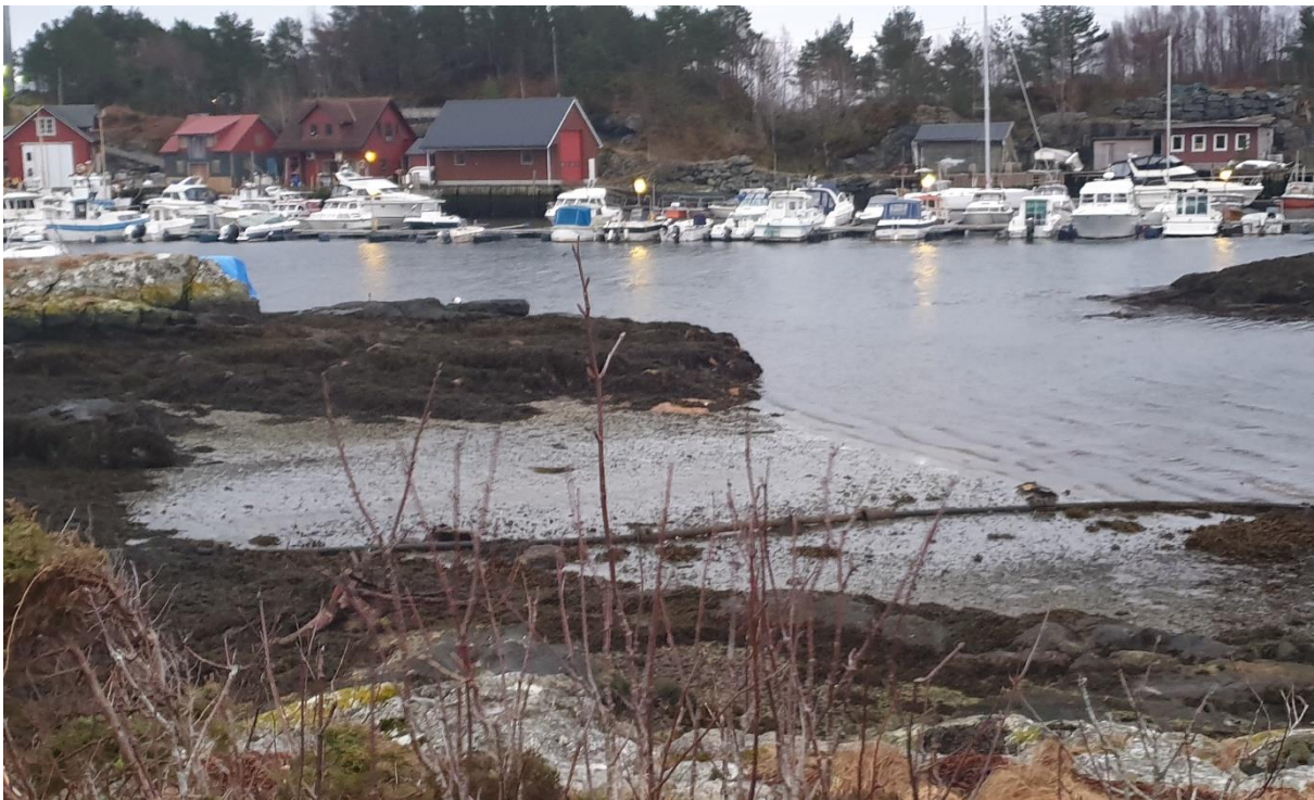
Figur 5: Bilde som viser området som vert berørt av planlagde tiltak (John Sigurd Solberg).