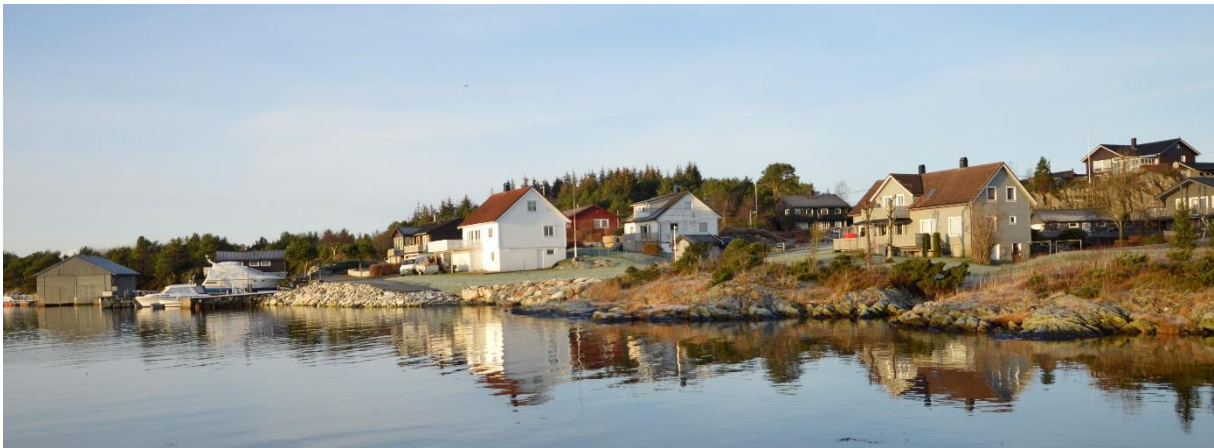
Figur 6: Syner berørt strandsona i området

Det er ikkje registrert kulturminne eller viktige naturvernområde innanfor planområdet. Plan inneberer tiltak i strandsona og det vert dermed eit viktig tema i planprosessen. Kring området planlagd for utbygging er strandsona allereie sterkt påverka. Kinn kommune har også utført ei utfylling i området i høve etablering av eit VA-anlegg.