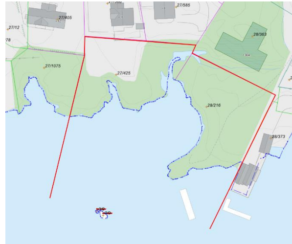
Figur 2: Raud linje syner området som er tenkt nytta til tiltak ( www.kommunekart.com/iVest Consult AS )