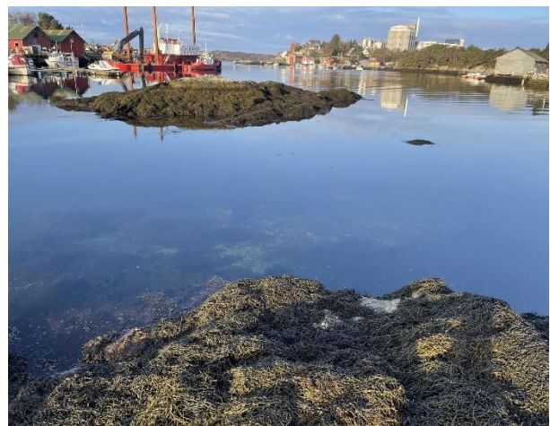
Figur 1: Bilda viser etablert avløpsledningar i dagen, og grunne mellom skjera der det er tenkt etablering av kaipir/molomellom (Jon Sigurd Solberg).