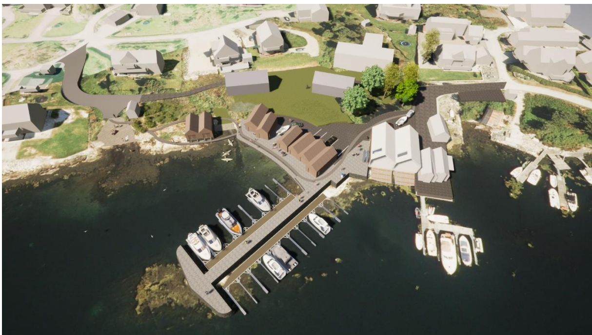
Figur 2: Illustrasjon som visar av planlagde tiltak der bygningsvolum er tilpassing i høve eksisterande bustadar og etablert naust i området (SALT Arkitekter).