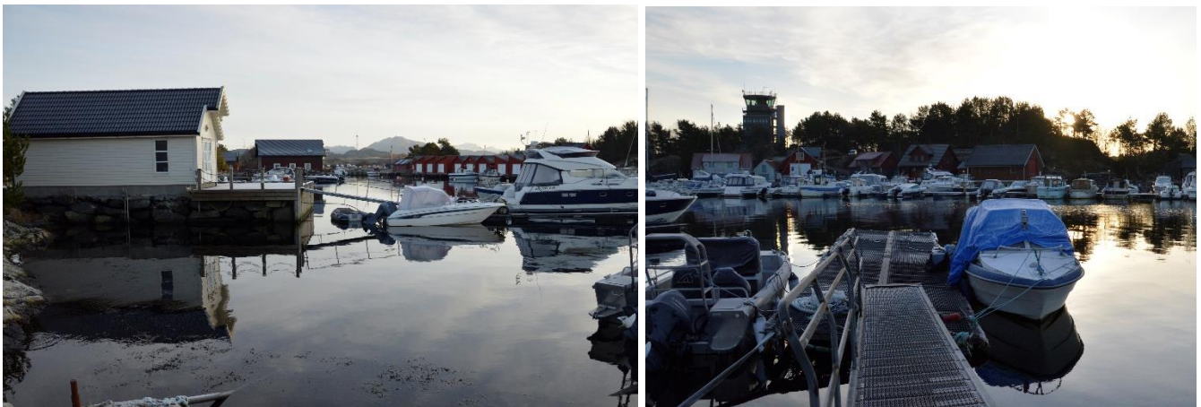
Figur 4: Syner den allereie berørte strandsona i området

I planarbeidet vil det bli lagt vekt på god arkitektur og funksjonelle løysingar. Estetisk utforming av bygga og materialbruk, skal tilpassast eksisterande bustader og naust i området. Det skal leggst til rette for universell utforming.