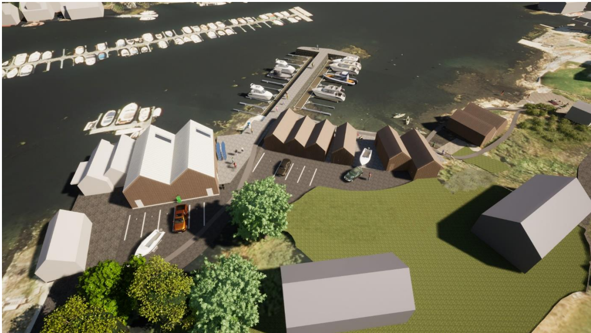
Figur 3: Illustrasjon som visar av planlagde tiltak der bygningsvolum er tilpassing i høve eksisterande bustadar og etablert naust i området (SALT Arkitekter).