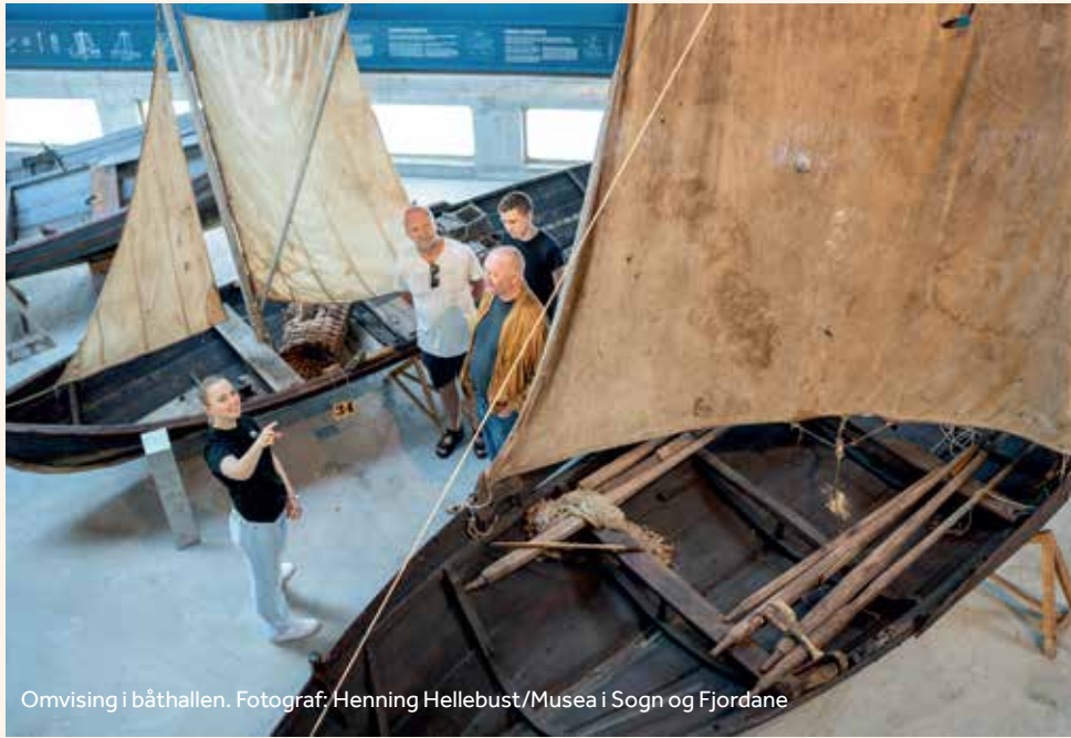
Omvising i båthallen.