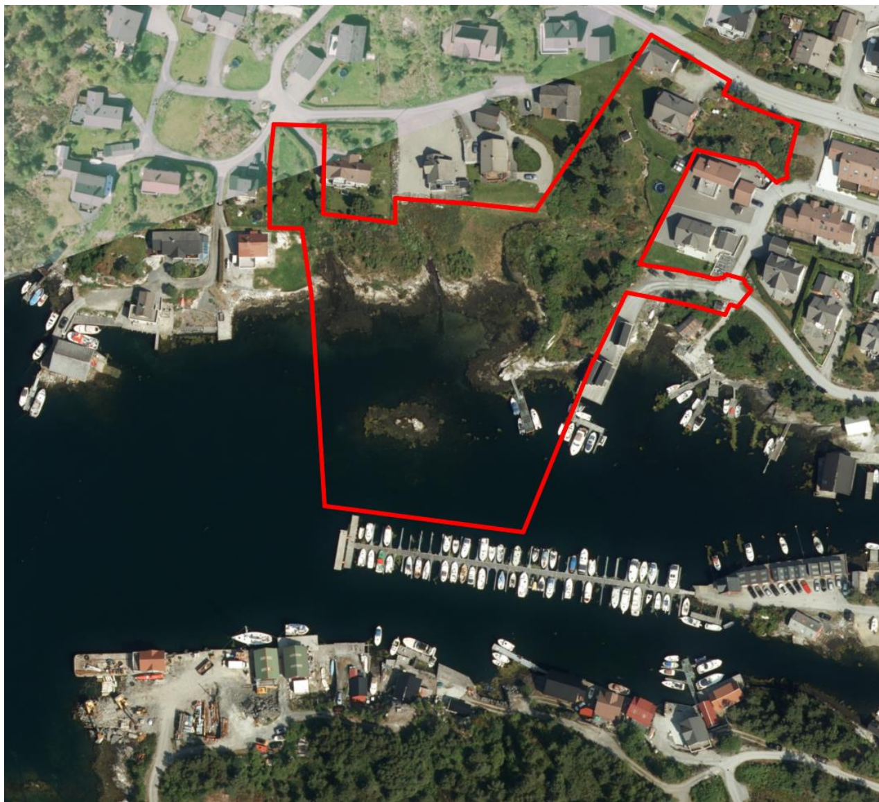
Figur 2: Kartutsnitt syner varsla planområde i raudt (iVest Consult)

Vedlegg: Kartutsnitt som syner varsla planområde