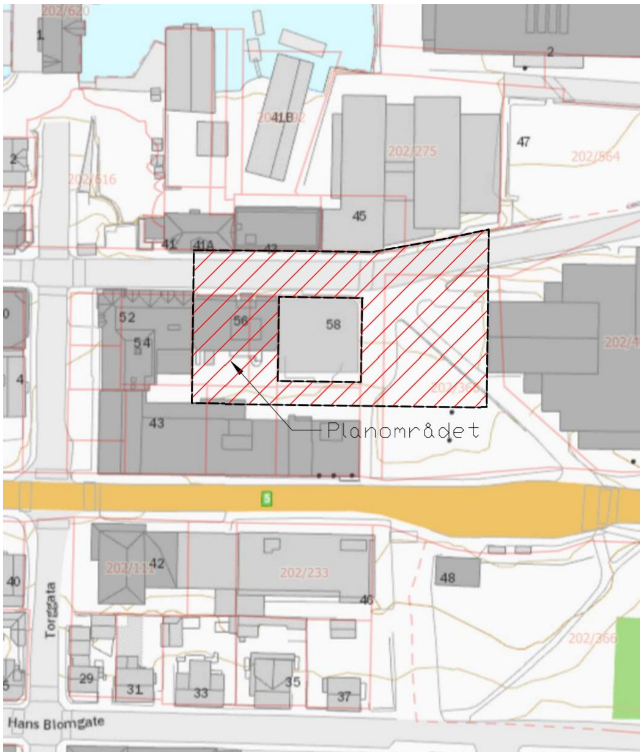
Kartutsnitt som viser lokalisering av planområdet.